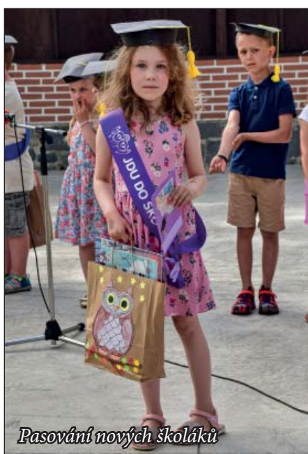
Pasování nových školáků