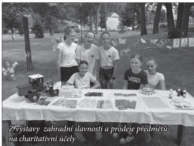
Z výstavy zahradní slavnosti a prodeje předmětů na charitativní účely