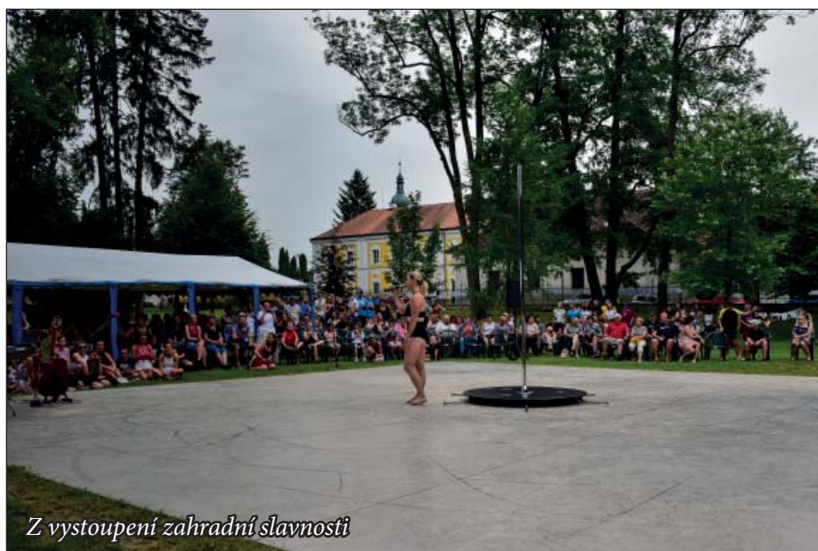
Z vystoupení zahradní slavnosti