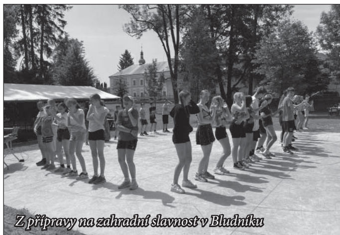
Z přípravy na zahradní slavnost v Bludňáku