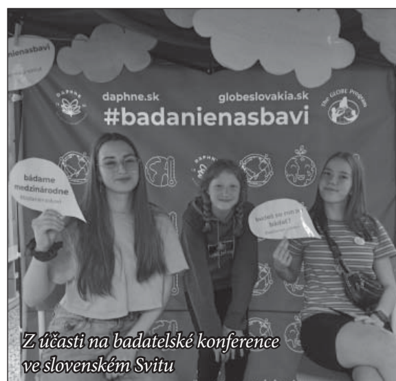
Z účasti na badatelské konferencie ve slovenském Svitu