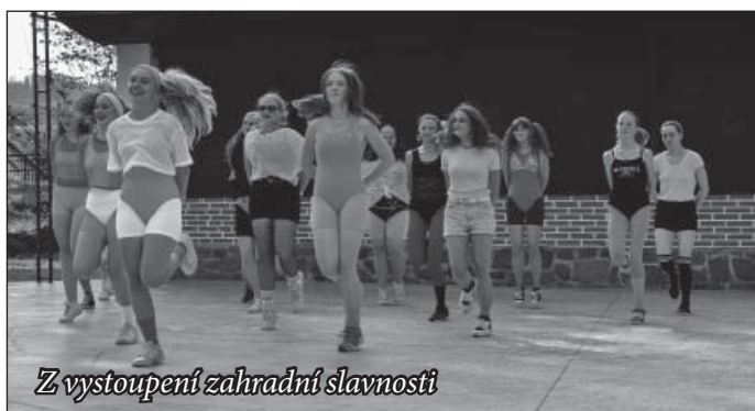
Z vystoupení zahradní slavnosti