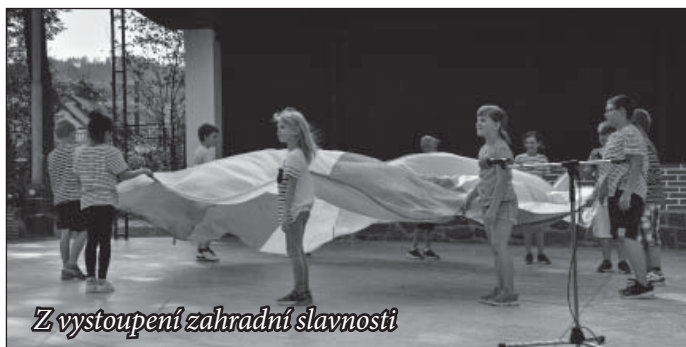
Z vystoupení zahradní slavnosti