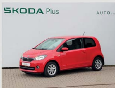
Skoda Citigo Elegance 1,0 TSI, 44 kW, automat