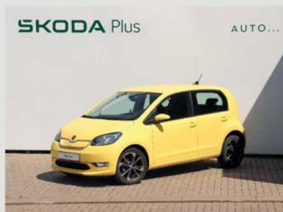
Skoda e-Citigo Style 37 kWh/61 kW, automat