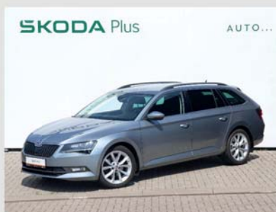
Škoda Superb Combi GRT Style 2,0 TDI, 110 kW, automat