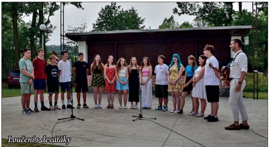
Loučení s devátáky