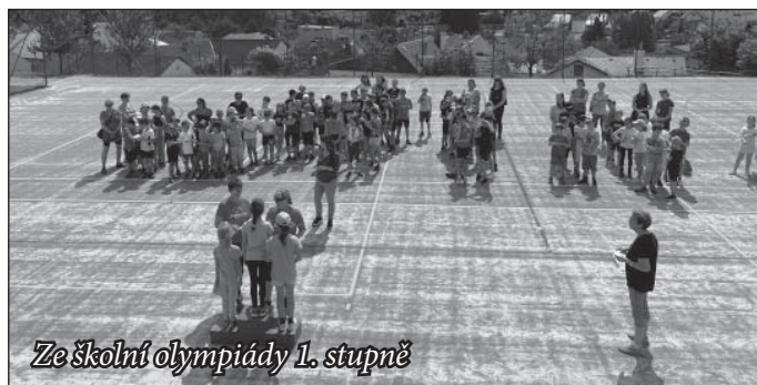
Ze školní olympiády 1. stupně