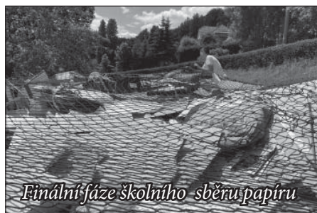
Finální fáze školního sběru papíru

Novinkou tohoto školního roku bude i nové logo školy , respektive obnovené a aktualizované logo vycházející z původní předlohy broučka s lucerničkou doplněného aktuálně správným názvem školy, který zahrnuje základní i mateřskou školu pomocí zkratky „ZŠ a MŠ Jimramov“. Pedagogická rada a školská rada naší školy vybrala dvě verze tohoto loga. Do konečného výběru loga chceme zapojit i naše žáky prostřednictvím žákovské rady (žákovský parlament, složený s genderově vyvážených zástupců jednotlivých tříd) jako příležitost zapojit se do tohoto výběru s možností spolurozhodovat o důležitém společném symbolu, který bude nás a naši školu