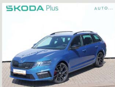
Škoda Octavia Combi RS 2,0 TSI, 180 kW, automat