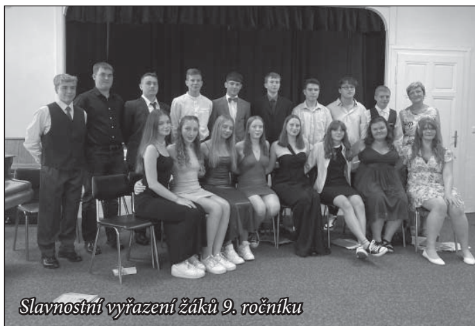
Slavnostní vyřazení žáků 9. ročníku

Zahajujeme nový školní rok a s ním vzhlížíme nejenom k výše zmíněné provozní problematice, ale samozřejmě i k aktuálním plánům rozvoje vzdělávání dětí a žáků na naší škole. O realizaci těchto plánů vás budeme informovat souhrnně ve zpravodaji městyse, ale především průběžně i na našich webových stránkách a facebookovém profilu. Máme v plánu představit novou koncepci rozvoje školy pro předškolní vzdělávání, na které pracujeme, a také rozvinout a aktualizovat koncepci základního vzdělávání mj. i v souvislosti s připravovanými změnami MŠMT na nový RVP ZV (rámcový vzdělávací program základního vzdělávání), které nás čekají již v blízkém časovém hori-