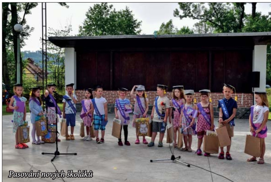
Pasování nových školáků

V letošním školním roce čeká jimramovskou školu významná akce v podobě rekonstrukce školní kuchyně s dlouhodobým dopadem na další desetiletí. Rekonstrukce bude zahájena na prahu nového kalendářního roku 2025 a potrvá několik měsíců. Její dokončení budeme očekávat v průběhu jara. Po ukončení stavebních úprav a instalaci veškerého nového vybavení v kuchyni se budeme těšit na kolaudaci této stavby, kterou plánujeme propojit se slavnostním dnem otevřených dveří naší školy namísto původně plánovaných větších oslav 115. výročí založení školy. Tato akce bude pro nás zpočátku znamenat dočasné provozní změny. Budeme muset totiž na nezbytně nutnou dobu vařit a dovážet obědy z jiného místa, ale jsme přesvědčení, že