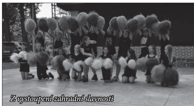
Z vystoupení zahradní slavnosti