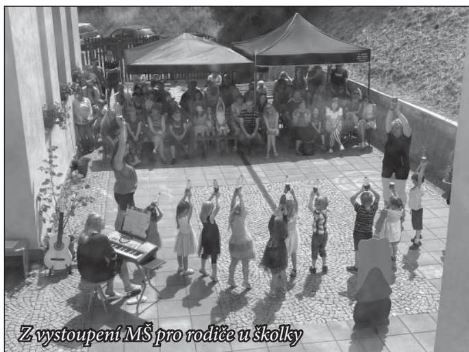
Z vystoupení MŠ pro rodiče u školky