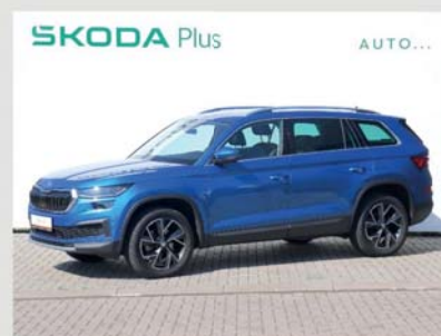
Škoda Kodiaq Style 2,0 TDI, 110 kW, automat