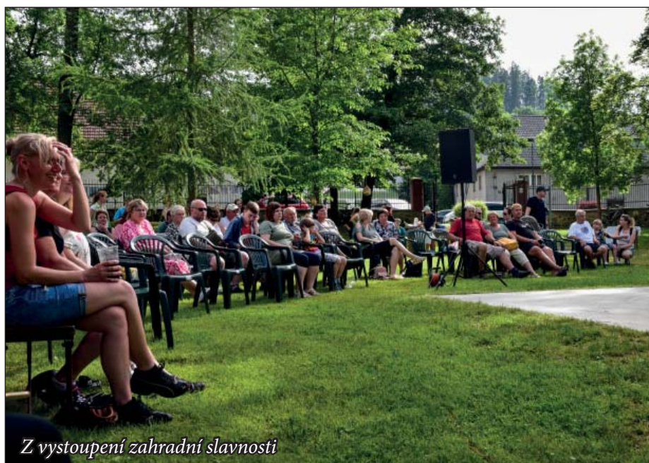
Z vystoupení zahradní slavnosti