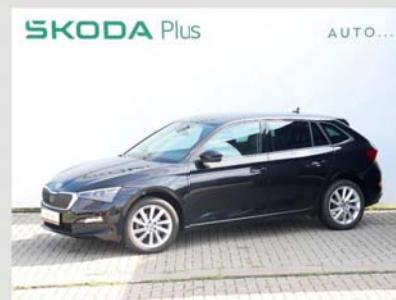
Skoda Scala Style 1,5 TSI, 110 kW, manuál